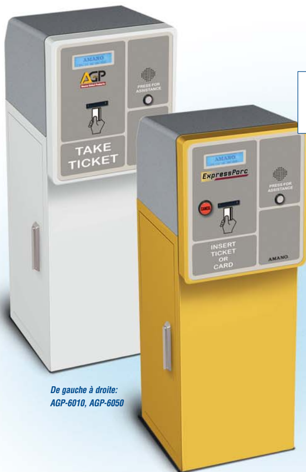
De gauche à droite: AGP-6010, AGP-6050